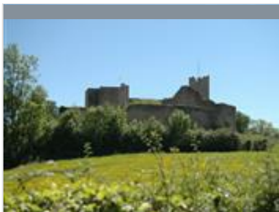
Les Trois Buttes