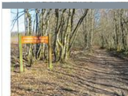
Boucle de l'Argentelet